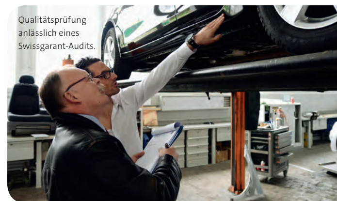
Qualitätsprüfung anlässlich eines Swissgarant-Audits.