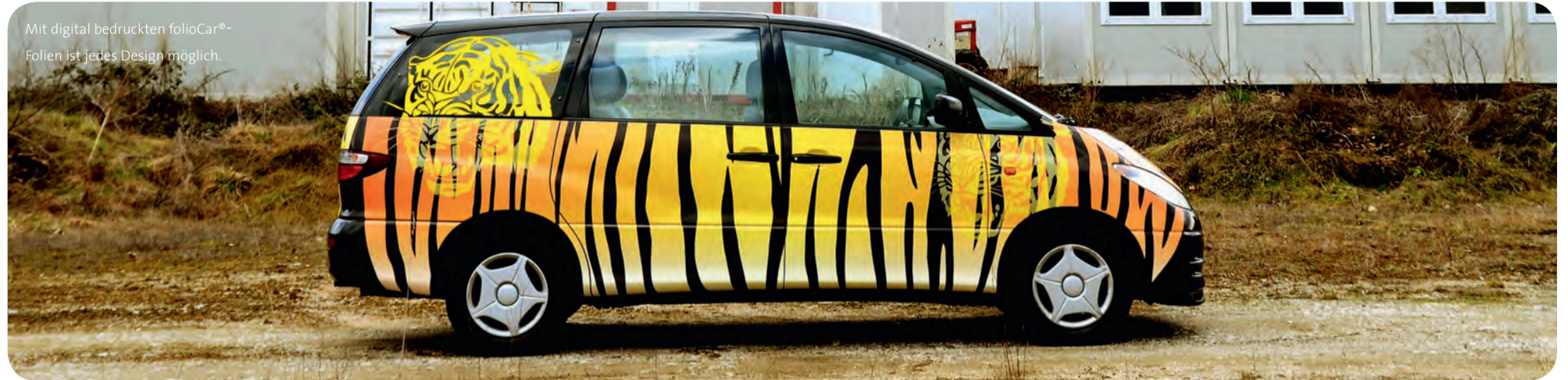
Mit digital bedruckten folioCar®-Folien ist jedes Design möglich.