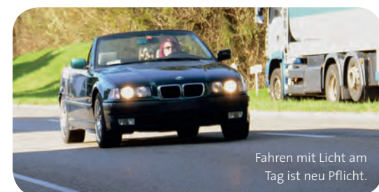
Fahren mit Licht am Tag ist neu Pflicht.